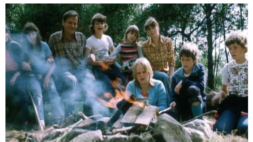
„Eine Berliner Arbeiterfamilie“