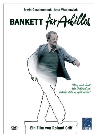
DVD „Bankett für Achilles“