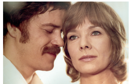
Jürgen Heinrich und Annekathrin Bürger in „Hostess“

Die Geschichte von der Gänseprinzessin und ihrem treuen Pferd Falada