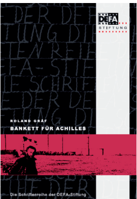
„Bankett für Achilles. Schwierigkeiten mit der Arbeiterklasse“