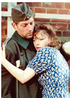
Szene aus DAS HAUS AM FLUSS (1985)