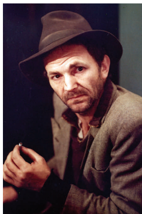
Michael Gwisdek in OLLE HENRY (1983)