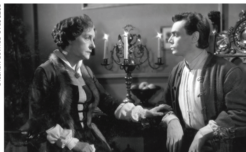
Henny Porten in DAS FRÄULEIN VON SCUDERI (1955)

Der nächste Filmabend findet am 1. Juli innerhalb der Filmreihe „Brüche und Kontinuitäten“ statt. Die Filmreihe läuft in Zusammenarbeit mit der Friedrich-Wilhelm-Murnau-Stiftung und widmet sich Schauspielern, die sowohl bei der Ufa als auch bei der DEFA auftraten. Präsentiert werden zwei Filme mit der Schauspielerin Henny Porten, darunter DAS FRÄULEIN VON SCUDERI (1955, Eugen York).