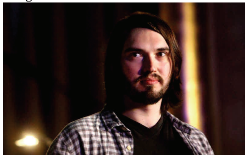
Aron Lehmann beim filmkunstfest in Schwerin

In Aron Lehmans Film verschwimmen die Grenzen zwischen Geschichte und Gegenwart, Erfindung und Wirklichkeit. Dass dies zwar oft komisch, aber keinesfalls albern wirkt, liegt an der klugen, zupackenden Regie, die fast traumwandlerisch auf dem schmalen Grat zwischen Komödie und Tragödie balanciert. Die Darsteller, allen voran Robert Gwisdek als alter ego des Regisseurs, harmonieren als Gruppe und verleihen ihren Figuren eine starke Individualität und absolute Glaubwürdigkeit. Die Kamera begleitet sie in impressiven, atmosphärischen Bildern. Der überlegte Einsatz von Geräuschen und Musik unterstützt die Ideen der Fabel aufs Beste. Ein poetisches Werk und eine Hommage an die Phantasie, die den Realitäten zu trotzen weiß. Insgesamt ein wunderbares Beispiel für die Kraft des jungen deutschen Kinos.