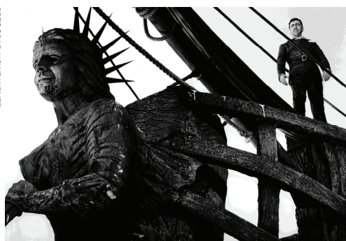
DER FLIEGENDE HOLLÄNDER (1964)