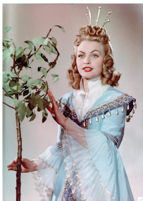
Christel Bodenstein als Prinzessin Tausendschön in DAS SINGENDE, KLINGENDE BÄUMCHEN (1957)