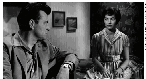
Szene aus SEPTEMBERLIEBE (1960)