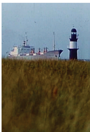
Szene aus JUBILÄUM EINER STADT—750 JAHRE ROSTOCK (1968)