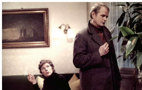
GLÜCK IM HINTERHAUS (1979)