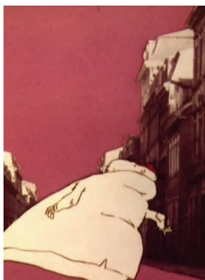
Szene aus IN MY NEIGHBOURHOOD (1990)

ein junger Regisseur, der trotz gestrichener Fördergelder seinen Historienfilm über den Rebellen Michael Kohlhaas zu verwirklichen sucht – mit unbändiger Energie, viel Herzblut und Imagination.