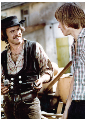
Szene aus VERDAMMT, ICH BIN ERWACHSEN (1974)

FOTOGRAF: EICHARDT HARTKOPF, CHRISTIA KÖFER