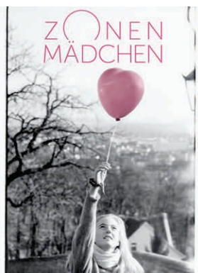
ZONENMÄDCHEN (Sabine Michel, 2013)