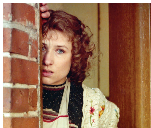
DAS HAUS AM FLUSS (Roland Gräf, 1985)