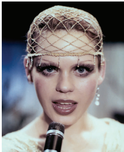
SOLO SUNNY (Konrad Wolf, 1980)