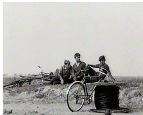
GRÜBE AUS SAMARTIEN FÜR DEN DICHTER JOHANNES BOBROWSKI (Volker Koepp, 1972)

Der Ausschnittsdienst von PROGRESS hat im letzten Jahr zahlreiche DEFA-Filmausschnitte für TV- und Kinofilme sowie für Ausstellungen verkauft. Darunter sind die TV-Produktionen DAS ADLON – DIE DOKUMENTATION (ZDF),