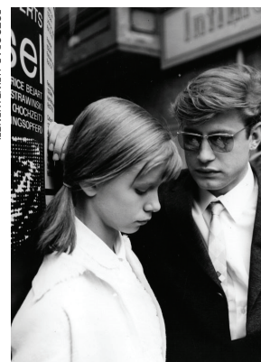
BERLIN UM DIE ECKE (Gerhard Klein, 1965)