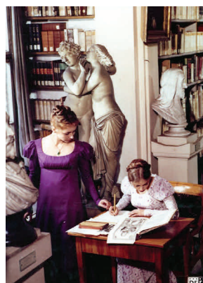
LOTTE IN WEIMAR (Egon Günther, 1975)