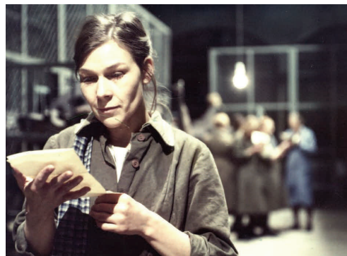
DIE VERLOBTE (Günter Reisch; Günther Rucker, 1980)

Bei Icestorm sind vier neue DVD erschienen: ZIRRI – DAS WOLKENSCHAF (Rolf Losansky, 1992), IKARUS (Heiner Carow, 1975), HIEV UP (Joachim Hasler, 1977), sowie Alles Trick 11, u. a. mit dem synchronisierten sowjetischen Animationsfilm REVANCHE IM SPIEL (B. Djoschkin, 1967). www.icestorm.de