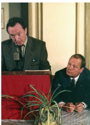
ZWEI SCHRÄGE VÖGEL (Erwin Stranka, 1989)