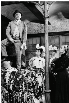
DER UNTERTAN (Wolfgang Staudte, 1951)