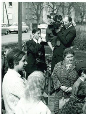
Eine Episode der „Kinder von Golzow“: WENN MAN VIERZEHN IST (Winfried Junge, 1969)

Filmpreises in München. Der 83-jährige Schauspieler wirkte in mehr als 130 Produktionen mit und begann seine Karriere bei der DEFA, u. a. mit NACKT UNTER WÖLFEN (Frank Beyer, 1962), EIN LORD AM ALEXANDERPLATZ (Günter Reisch, 1967) oder DIE FLUCHT (Roland Gräf, 1977). Außerdem gewannen Leopold Grün und Dirk Uhlig für AM ENDE DER MILCHSTRASSE (2012) den Preis für den besten Dokumentarfilm. Der Film wurde von der DEFA-Stiftung gefördert.