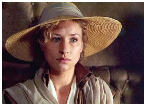
TREFFEN IN TRAVERS (Michael Gwisdek, 1988)

Anlässlich des 30. Todestages von Wolfgang Staudte am 19. Januar 2014 widmete das Filmfestival, zusammen mit der Wolfgang Staudte Gesellschaft, seine diesjährige Hommage dem in Saarbrücken gebürtigen Regisseur und zeigte HERRENPARTIE (1964). Die Hommage wurde von der DEFA-Stiftung unterstützt. www.max-ophuels-preis.de